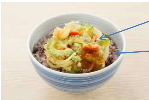
「夏越ごはん」イメージ

「夏越ごはん」は、「夏越の祓」の茅の輪の由来となった、蘇民将来(そみんしょうらい)が素盞鳴尊(すさのおのみこと)を「粟飯」でもてなしたという伝承にならった「粟」、邪気を祓う「豆」などの雑穀の入ったごはん、茅の輪をイメージした緑や、邪気を祓う赤の旬の夏野菜の丸いかき揚げをのせ、百邪を防ぐといわれる旬のしょうがを効かせたさっぱりおろしだれをかけたごはんを基本としています。