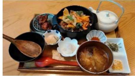
GOHANYA'GOHAN みなとみらい店 ＜「夏越し祓」定食＞