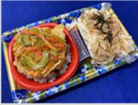
夏越ごはん&讃岐うどんセット