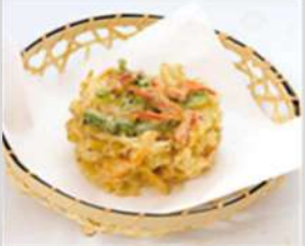
夏野菜の彩りかき揚げ