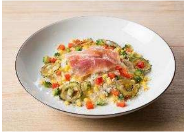
AWkitchen ＜夏野菜と18ヶ月熟成プロシュートの夏越しリゾット＞

「夏越ごはん」メニューは、飲食店、スーパーマーケットで、新たな展開店舗が決定しています。飲食店においては、「AWkitchen」都内2店舗での期間限定メニューの提供が決定。スーパーマーケットにおいては、「イトーヨーカ堂」の首都圏全店舗、福島県いわき市と茨城県内で展開する「マルト」の2店舗、福岡県を中心に展開する「西鉄ストア」北部九州60店舗での期間限定販売が決定いたしました。また、(株)ミツハシライスが首都圏のスーパーマーケット約450店舗で「夏越ごはんおにぎり」を販売するほか、直営店GOHANYA'GOHAN みなとみらい店での限定メニューを販売いたします。その他、(株)グリーンハウスや(株)フジランドが運営する社員食堂での提供も決定しています。