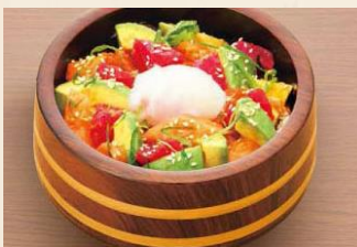
【まぐろサーモンアボカド丼】1,180円