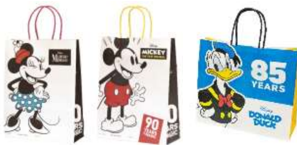
ミニーマウス Ver. ミッキーマウス Ver. ドナルドダック Ver.