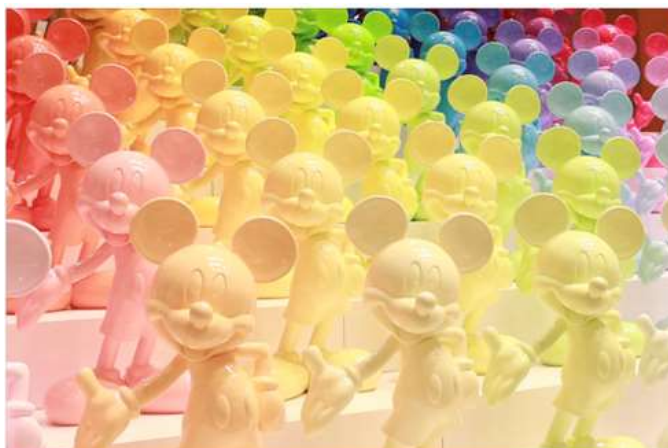
スタチュー(ミッキーマウス、ミニーマウス、ドナルドダック)