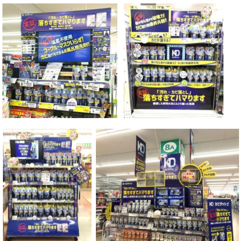
店舗での展開の様子

今後も、店頭での商品訴求方法を工夫しつつ、ユーザーに喜んでいただける商品を提案していきます。