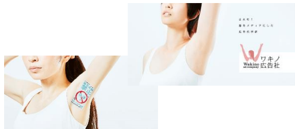
「ワキノ広告社」イメージ画像

ワキのプロモーションの一環として、「白ワキ姫」と「ワキノ広告社」コラボ動画を制作。さらに、ワキノ広告社では会社設立を記念して、「第一回 国民的ワキ美人コンテスト」を開催し、話題となりました。