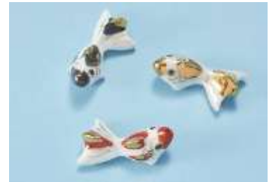
店舗：日本橋 箸長 名称：京焼 金魚箸置き 価格：756円 場所：コレド室町 3 2F