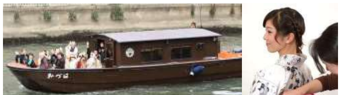
日本橋クルージング ゆかた&アートアクアリウム特典