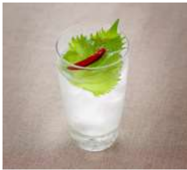
店舗：日本橋だし場 はなれ 名称：焼酎カクテル「金魚」 価格：660 円 場所：コレド室町 2 1F