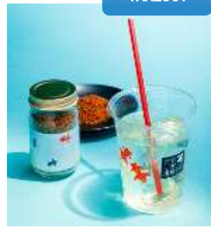
店舗：にんべん 日本橋本店 名称：左/金魚びん 鯉節ふりかけ 右/ICE DASHI 価格：左/756 円 右/250 円 場所：コレド室町 1 1F