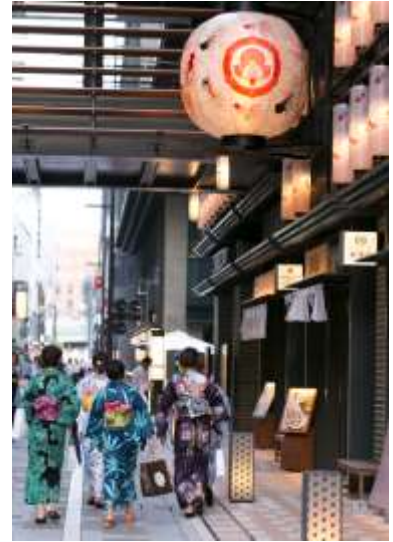
金魚大提灯 昨年の様子