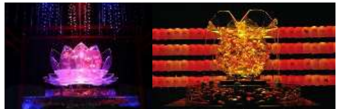
1万匹以上の観賞魚が優雅に舞い泳ぐ幻想的な“涼”体験