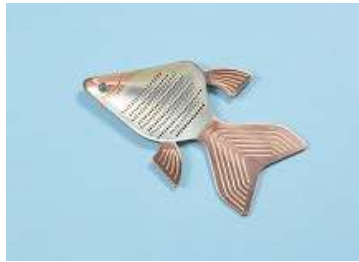
店舗：日本橋 木屋 名称：薬味おろし純銅江戸流金 価格：1,944円 場所：コレド室町 1 1F