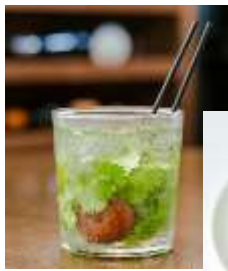
店舗：ピキニ ピカール 名称：左/アジアンモヒート 右/3 種トマトのピクルス 価格：左/800 円 右/864 円 場所：コレド室町 1 2F