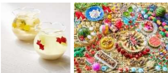
目にも鮮やかな街の金魚スイーツ&バルさんぽ