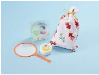
店舗：まかないこすめ 名称：金魚すくいハンドケアセット 価格：2,484円 場所：コレド室町 3 3F