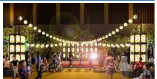
アートアクアリウム夏祭り 会場イメージ