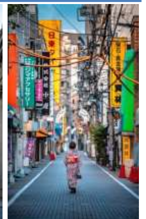
デジタルサイネージイメージ