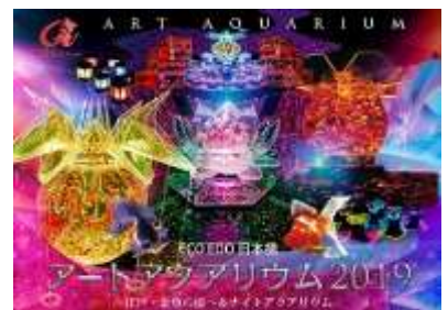
アートアクアリウム 2019 メインビジュアル

問い合わせ先：アートアクアリウム運営事務局 TEL 03-3270-2590[開設期間 7 月 4 日(木)～9 月 23 日(月・祝)10:30～20:00]