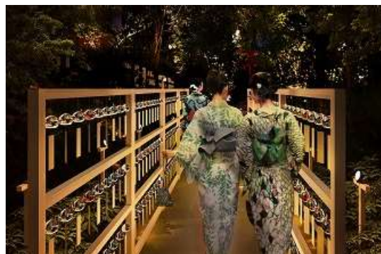
森の風鈴小径 ライトアップイメージ