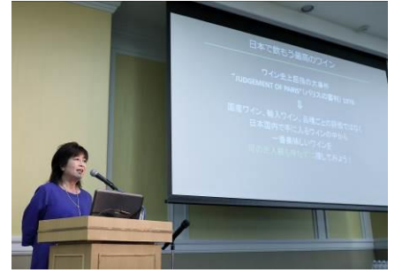
ワイン品評会 開会式(左)、専門家審査員の紹介(中)、愛好家オリエンテーション(右)の様子(2019年7月7日)