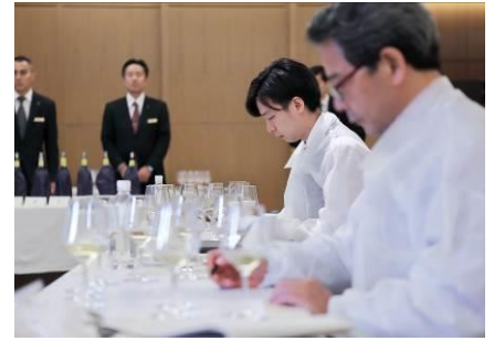
ワイン品評会 愛好家審査員審査(左)、専門家審査員審査(中、右)の様子(2019年7月7日、8日)