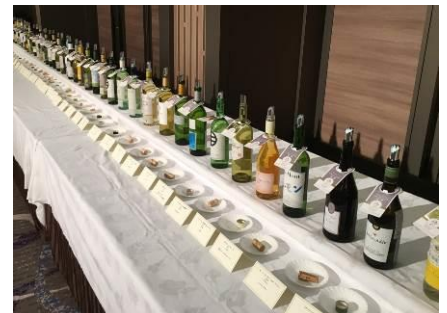
ベストワイン受賞式(左)、テイasting会の様子(2018年9月3日)