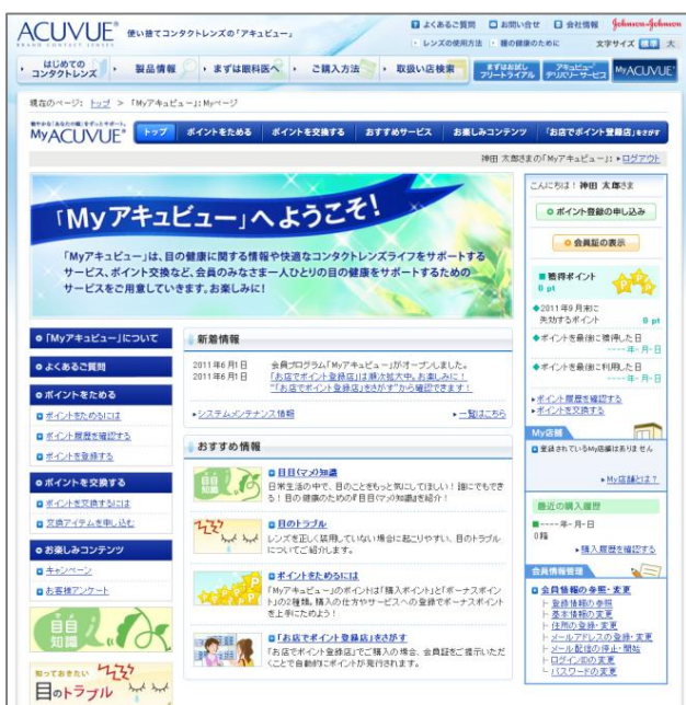
『My ページ』画面イメージ