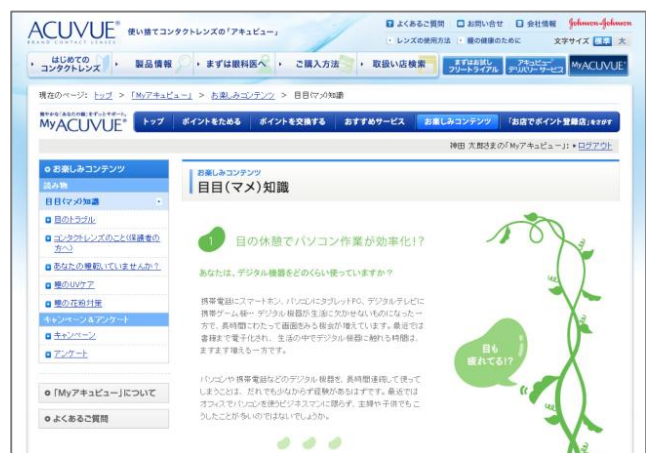
『目目(マメ)知識』ページ画面イメージ