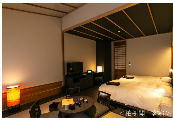
< 柏樹関 客室 >