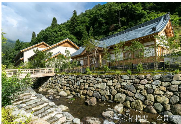
< 柏樹関 全景 >

禅に親しみ、越前のおもてなしに親しみ、こころを癒す体験の宿、それが永平寺 親禪の宿 柏樹関です。