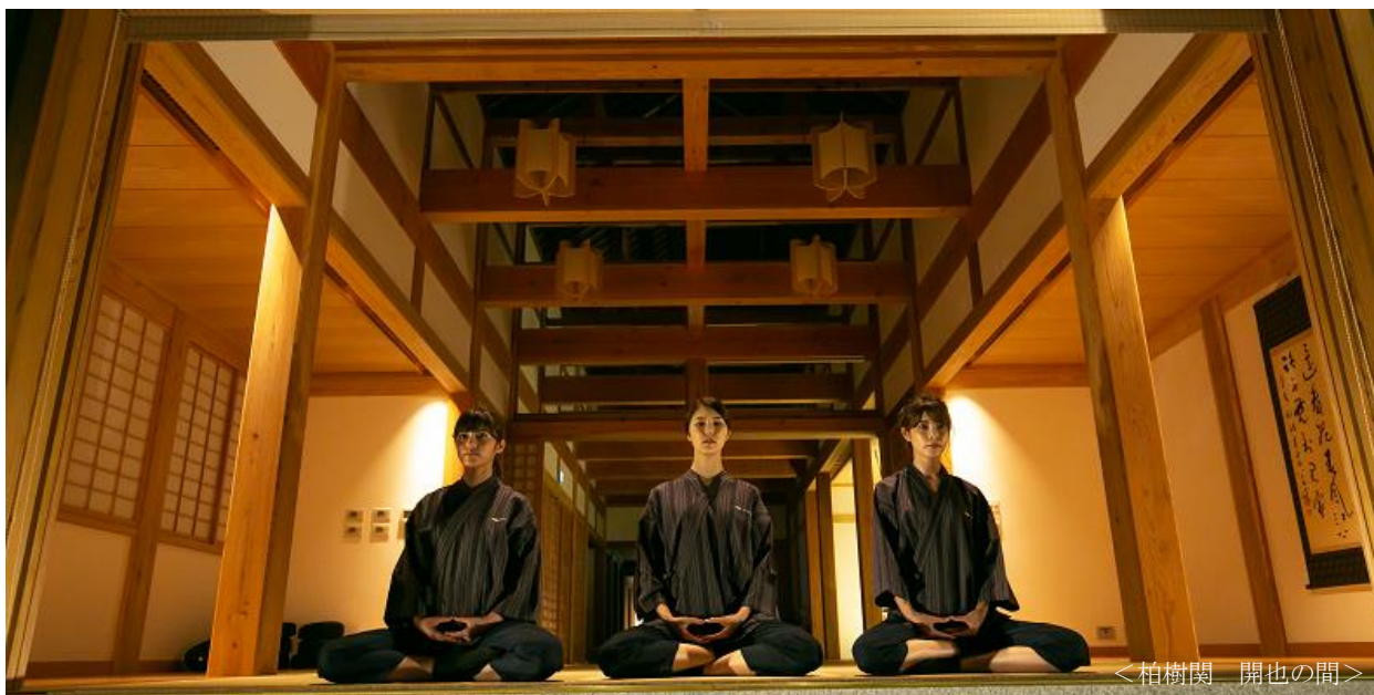
< 柏樹関 開也の間 >