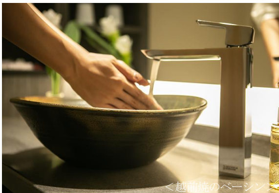
＜越前焼のベーンシ＞