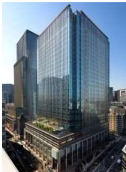
日本橋室町三井タワー外観