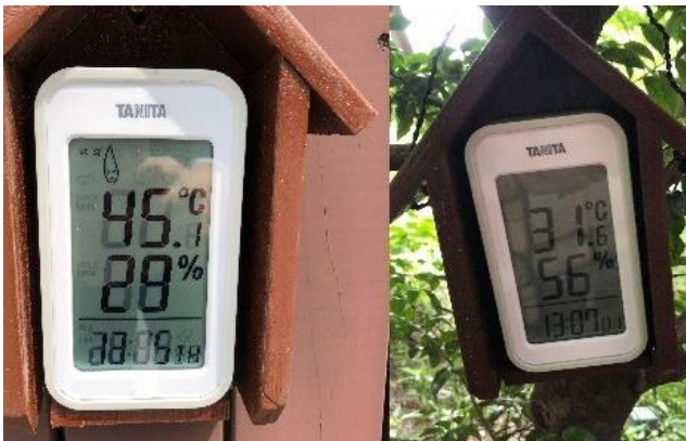
ある酷暑の日の温度計数値（2018年）