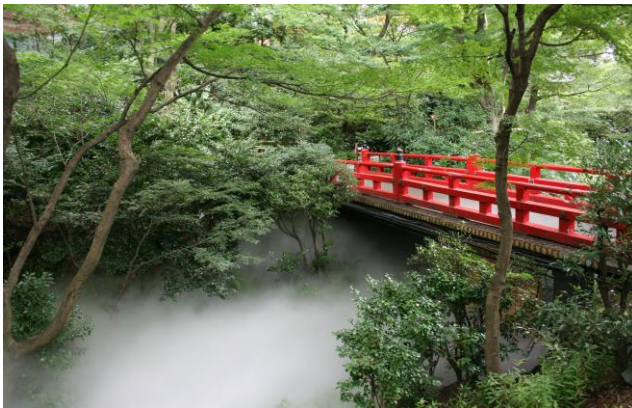
庭園内でのミスト噴出

広大な敷地を深緑が覆うホテル椿山莊東京庭園での、木陰の心地よさは格別です。昨年、庭園内弁慶橋付近とホテルエントランス付近に設置した温度計では10℃以上も差が出て、庭園内の温度がいかに涼しいかが数値でも分かりました。また庭園内でのミストの噴出があるほか、ショップでは濃厚でコクが深い2種類のチーズを使用したひんやりスイーツを販売しており、酷暑が続く東京にいながら、さまざまな“涼”体験をお楽しみいただけます。