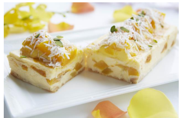
マスカルポーネとマンゴーのひんやりチーズケーキ