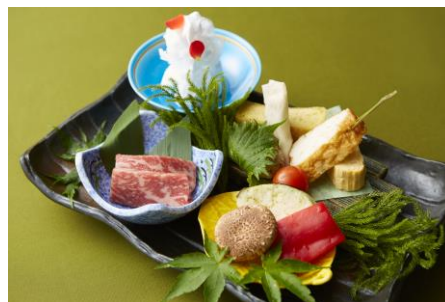
石焼料理「木春堂」 石焼ランチ～木立～

■お問い合わせ：03-3943-5506 (マーケティング課 平日 10:00～18:00)