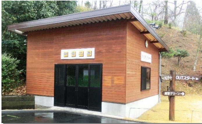
左 : 工房 中段左 : 振動数測定器 中段中 : 弾道測定器 中段右 : 同上 下 段 : チラン