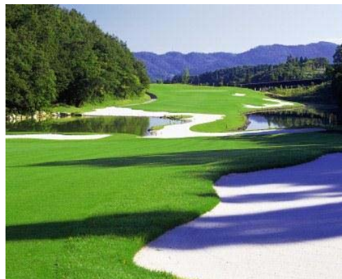
▲ 美しく戦略性の高いコース

「御嵩工房」は、御嵩花トピア C のスタートテラスにあるスイングチェックコーナーを改修しオープンするもので、従来クラブハウス内のプロショップで行っていたグリップ交換に加え、新たにクラブ無料診断を開始いたします。