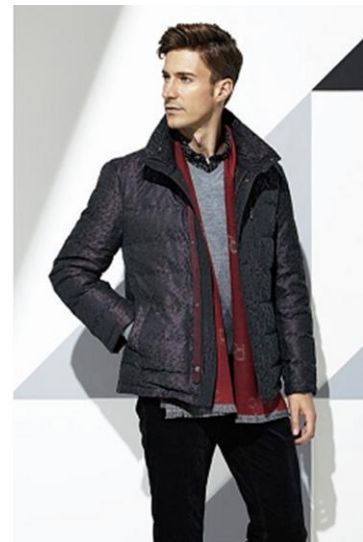
■ 右: ダウンブルゾン(ポリエステル 69%、綿 31%) 100,000 円+税、 シャツ(綿 100%) 33,000 円+税 ニット(毛 100%) 36,000 円+税、 ストール(絹 100%) 23,000 円+税 パンツ(ポリエステル 55%、綿 27%、レーヨン 15%、ポリウレタン 3%) 33,000 円+税