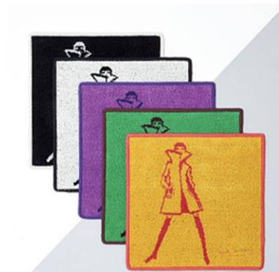
■ タオルハンカチ 2,500 円+税