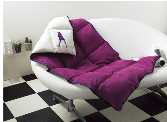
■ 羽毛ひざ掛 25,000 円+税