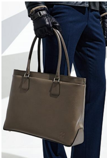
■ 左: ブリーフバッグ(牛革) 120,000 円+税