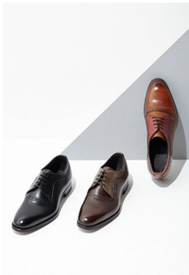
■ 中央: 紳士靴 34,000 円+税