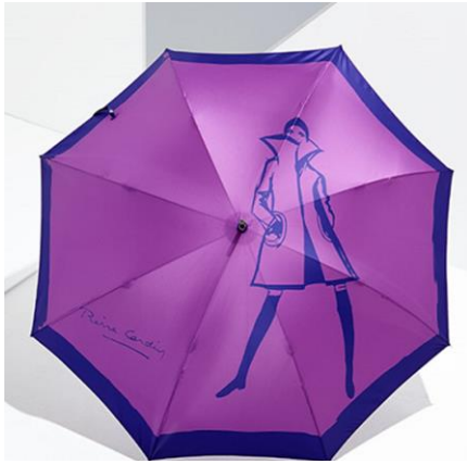
■ 婦人長傘 13,000 円+税