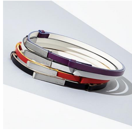
■ ベルト 6,500 円+税