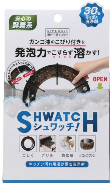
シュワッチ パッケージ画像

■「シュワッチ」ECサイト： https://fan.liberta.net/item/ouchikirei/shwatch/14965/