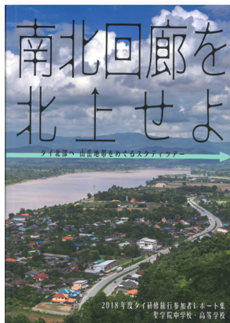
「南北回廊を北上せよ」表紙

聖学院中学校・高等学校 〒114-8502 東京都北区中里3-12-1 Tel 03-3917-1121 URL https://www.seig-boys.org/