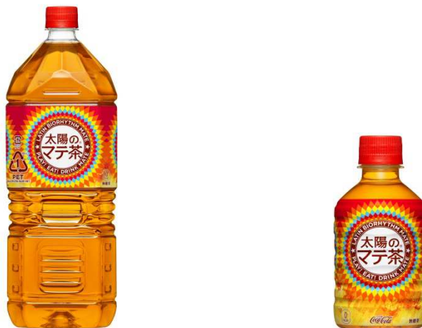
「太陽のマテ茶」 2LPET/280mlPET 製品画像