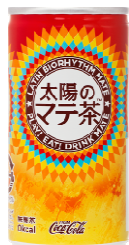
「太陽のマテ茶」185g 試飲缶

「太陽のマテ茶」オフィスサンプリングは、ブランドWEBサイトからご応募いただいた先着 1 万名様の在籍オフィスに、「太陽のマテ茶」試飲缶 30 本をはじめオリジナルグッズを詰め合わせた『太陽のマテ茶キット』をプレゼントします。「太陽のマテ茶」を、ランチ、残業時や飲み会前に、職場の同僚や上司の方々へのコミュニケーションツールとしてご活用、配布していただくことで、「太陽のマテ茶」の一度飲んだらハマる味と、ラテンな世界観をお楽しみください。