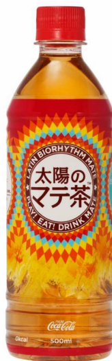
「太陽のマテ茶」(500mlPET)製品画像