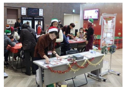
クリスマスワークショップの様子