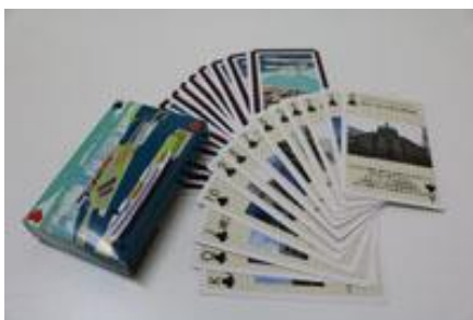
学生デザインのトランプ

令和元年度 スタンプラリーの開催、クリスマスワークショップの開催、モザイクアート展示（予定）