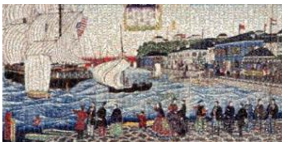
作年度展示したモザイクアート