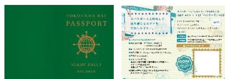
スタンプラリー台帳イメージ

横浜赤レンガ倉庫 2 号館、横浜港大さん橋国際客船ターミナル、神奈川県立歴史博物館、よこはまコスモワールド、日本郵船歴史博物館、ニュースパーク、横浜みなとみらい万葉倶楽部、横浜市開港記念会館、横浜税関、横浜ワールドポーターズ（五十音順）