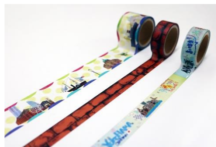
横浜をイメージしたマスキングテープ