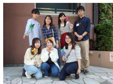
モザイクアートの写真撮影をしたゼミ生