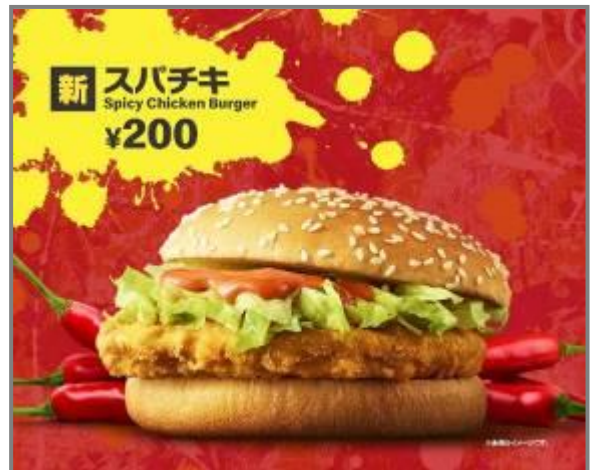
※画像はイメージです。

「スパチキ」の一番のこだわりである、唐辛子の辛さとガーリックの旨みが効いた絶妙な辛さのスパイシーソースが、ペッパーの効いたサクサクのチキンパティ、シャキシャキのレタスと相性抜群の一品です。ピリッと刺激的な旨辛ソースがやみつきになる「スパチキ」は、単品200円(税込)、バリューセット500円(税込)と、おてごろ価格でお楽しみいただけます。さらに17時からの夜マックでは、プラス100円でパティが倍になる「倍スパチキ」もぜひお試しください。