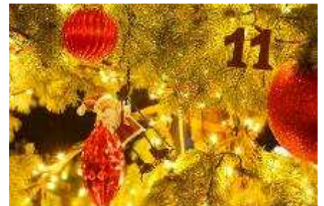
▲きらめく光で迎える「ツリーイルミネーション」