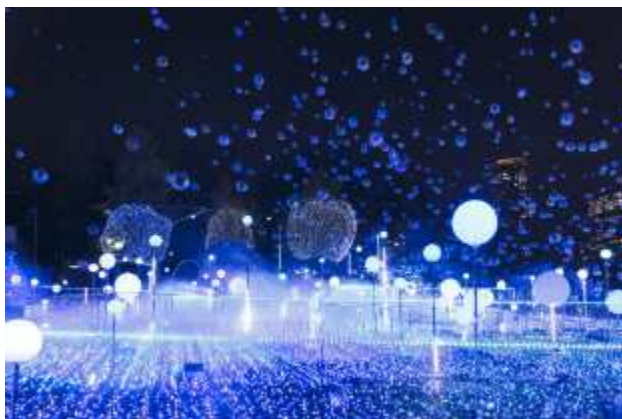
▲「クリスタルしゃぼん」(昨年の様子)

期間限定演出「しゃぼん玉イルミネーション」では、1日約45万個のしゃぼん玉がスターライトガーデンをより立体的に見せ、きらめく小さな「クリスタルしゃぼん」と、はじけた瞬間にスモークとなる「スモークしゃぼん」の2種類のしゃぼん玉が上空に舞い上がります。星々の誕生から、輝き、それらが爆発する宇宙の姿を表現します。