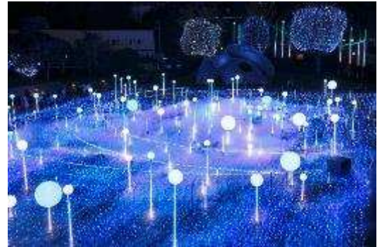
▲「スターライトガーデン」(昨年の様子)