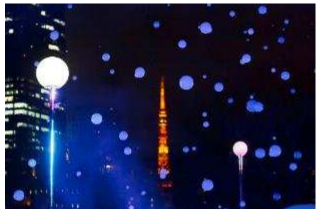
▲「スモークしゃぼん」(昨年の様子)