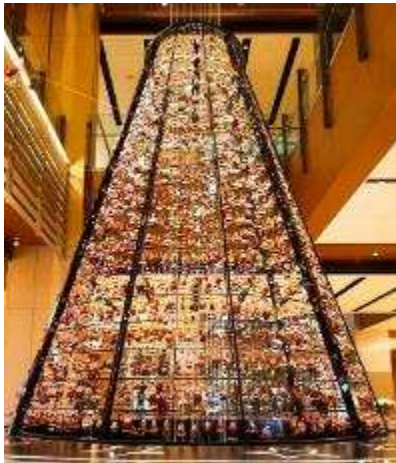
▲小さなサンタが約 1,800 体登場