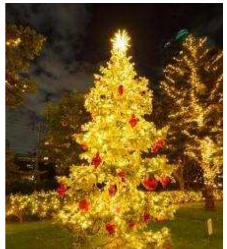
▲「ツリーイルミネーション」