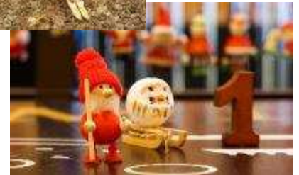
▲館内各所にお出かけている気まぐれサンタを探す楽しみも