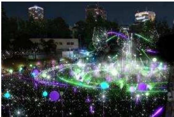
▲ ブラックホールシーン(イメージ)

宇宙を漂う星雲の誕生から始まるスターライトガーデン。今年初登場する8mの“Space Tower”を中心に、流星が駆けめぐる様子やブラックホールに飲み込まれていく光、引きつけられていく星々を表現します。クライマックスは広大な空間を最大限に活かし、エネルギーの放出と共に小さな光が星々へ成長していく様子を立体的に演出します。