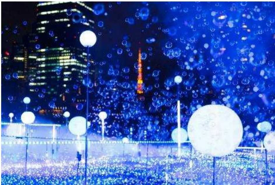
▲さまざまな宇宙現象を表現するメインイルミネーション「スターライトガーデン 2019」 実施期間:2019年11月26日(火)から12月25日(水) 期間限定演出「しゃぼん玉イルミネーション」(写真・昨年の様子)は12月18日(水)まで

東京ミッドタウン(港区赤坂 / 事業者代表 三井不動産株式会社)は、2019年11月14日(木)から12月25日(水)の期間クリスマスイベント『MIDTOWN CHRISTMAS 2019(ミッドタウン クリスマス)』を開催いたします。毎年大人気のメインイベント「スターライトガーデン 2019」は2019年11月26日(火)から12月25日(水)の期間、実施します。