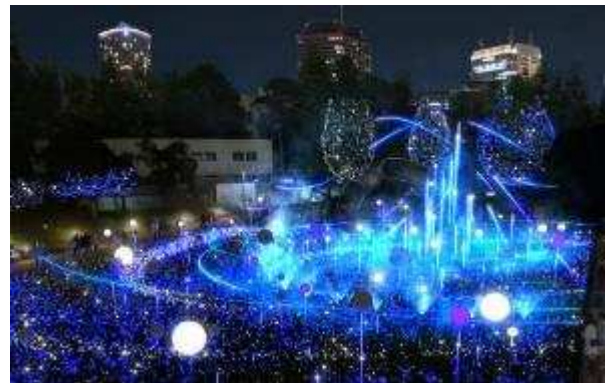
▲ 流星群シーン(イメージ)