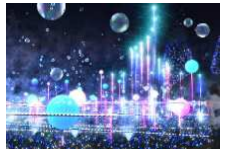
▲高さ8mの「Space Tower」 (イメージ)

毎年好評をいただいているメインイルミネーション「スターライトガーデン 2019」は、約2,000㎡の広大な芝生広場で宇宙空間をテーマに開催し、今年で13回目を迎えます。宇宙を漂う星雲の誕生から始まる今年の演出は、流星が駆けめぐる様子、ブラックホールに飲み込まれ、引きつけられていく光や星、新しいエネルギーの放出から生まれた小さな光が次第に星々へと成長していく宇宙現象を描きます。