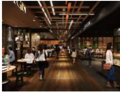
地下1階 飲食フロア イメージ

ちょい飲みからディナーまで、多様な夜の楽しみ方を提供する飲食店舗を中心に、モーニング、ランチ、テイクアウト、二次会等のワーカークラスにも対応可能な、地下の賑わいの中心となる飲食ゾーンが広がります。