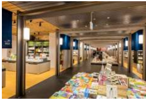
「誠品書店(書籍ゾーン)」