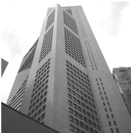
駐在員事務所が入居するオフィスビル外観

シンガポール駐在員事務所は、当面日本からの駐在員2名を含む3名で業務を開始しますが、将来的には現地法人化を検討し、業務内容を順次拡大していく方針です。