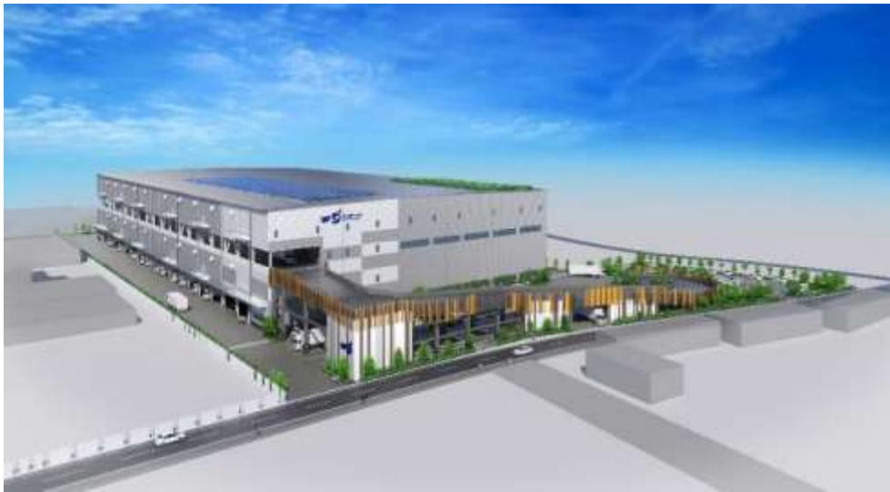
<外観イメージパース>

国道 16 号・東関東道へのアクセスが良く、人口集積地からも近い立地。周辺エリアへの地域配送に加え都心へのアクセスにも優れる。