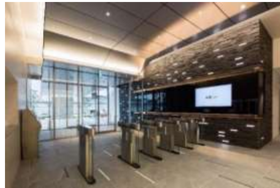
<エントランス(セキュリティゲート)>

「MFLP 船橋・&GATE」には、厨房付きの「カフェテリア」やシャワー・更衣室を完備した「フィットネスルーム」、MFLP 船橋の従業員も利用可能な「保育施設(企業主導型)」を設けたほか、施設従業員に自由で新しいワークスタイルを提供するオープンオフィススペース「Logi Community Lounge」も整備。さらには、仮眠も可能な「レストルーム」やトランクルーム・ワイン倉庫機能を備えた「ストレージサービス」など、幅広い機能を兼ね備えた MFLP 船橋全体の付帯施設となります。