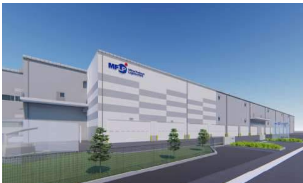
<外観イメージパース>

九州の高速道路網の結節点である「鳥栖」JCT・「鳥栖」IC より至近であり、九州全域へのアクセスに優れた立地。国道3号線沿いに位置し視認性も高い。JR「田代」駅も徒歩圏内。