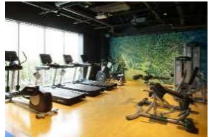
<フィットネスルーム>