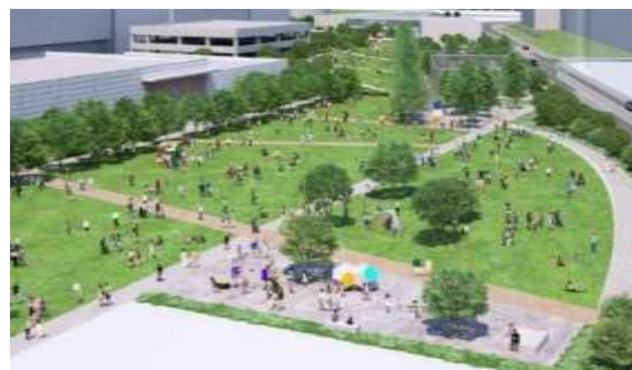
<緑地空間イメージ>