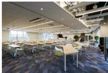
<オープンオフィススペース>