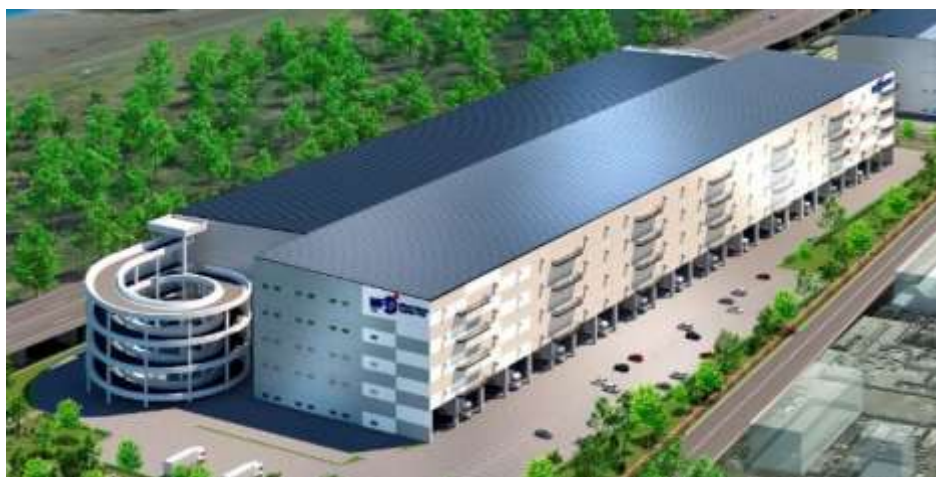
<外観イメージパース>

「海老名」IC に隣接しており、圏央道や東名自動車道へのアクセスが至便。地域配送拠点のみならず全国広域配送のポテンシャルも高い物流好立地に位置する。