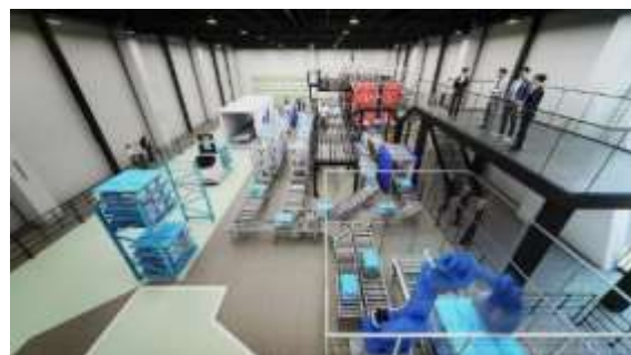
<MFLP ICT LABO 2.0 イメージ>