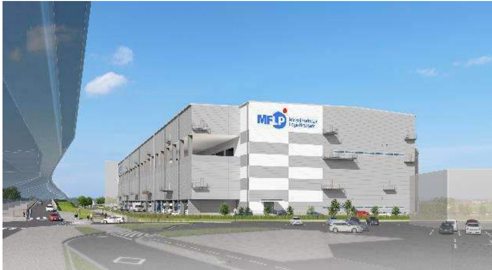
<外観イメージパース>

希少性の高い関西内陸物件。国道一号線沿いかつ第二京阪「交野南」ICも至近。JR 学研都市線「星田」駅徒歩圏内であり、雇用確保に強み。