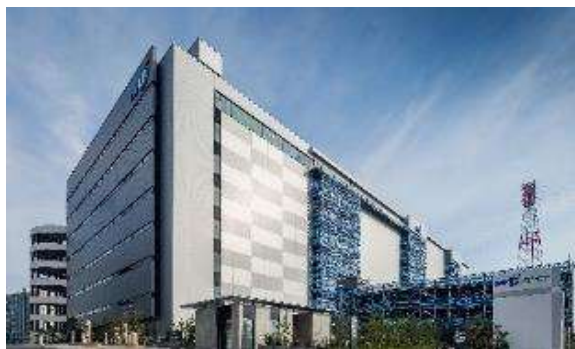
<MFLP 船橋Ⅱ 外観写真>