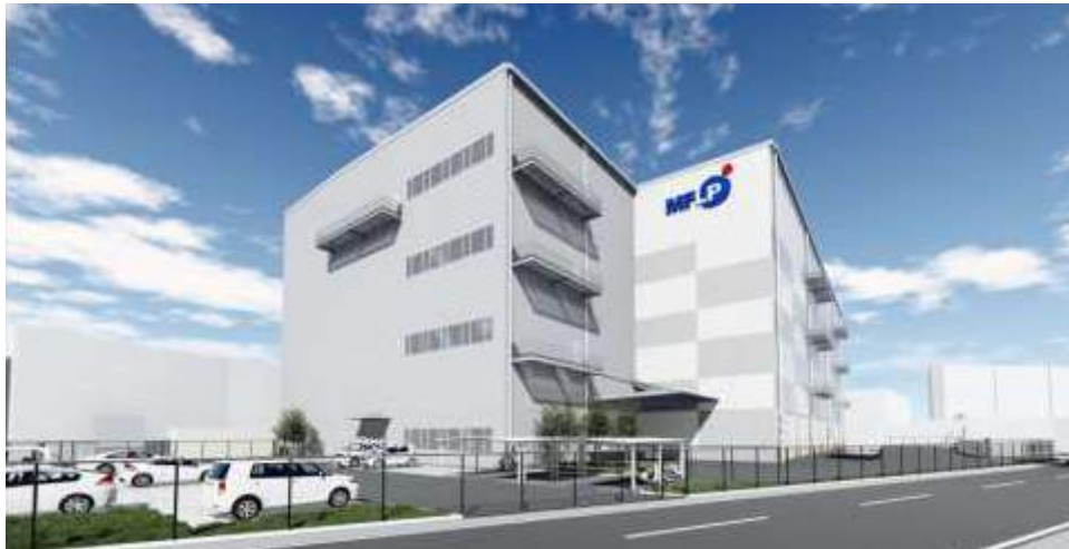
<外観イメージパース>

「所沢」ICより車で約8分の立地を生かした物流拠点。テナントからの建替えニーズによる開発。