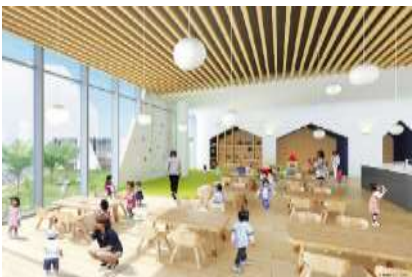
<保育施設(イメージ)>