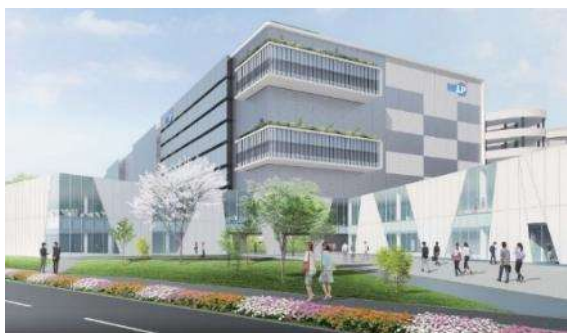
<「三井不動産ロジスティクスパーク船橋Ⅲ」外観イメージ>