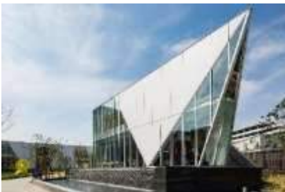
<MFLP 船橋・&GATE 外観写真>

「MFLP 船橋・&GATE」には、厨房付きの「カフェテリア」やシャワー・更衣室を完備した「フィットネスルーム」、MFLP 船橋の従業員も利用可能な「保育施設(企業主導型)」を設けたほか、施設従業員に自由で新しいワークスタイルを提供するオープンオフィススペース「Logi Community Lounge」も整備。さらには、仮眠も可能な「レストルーム」やトランクルーム・ワイン倉庫機能を備えた「ストレージサービス」など、幅広い機能を兼ね備えた MFLP 船橋全体の付帯施設となります。