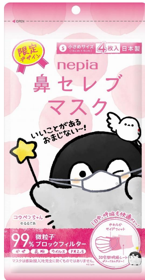
ネピア 鼻セレブマスク 小さめサイズ コウペンちゃんオリジナルパッケージ