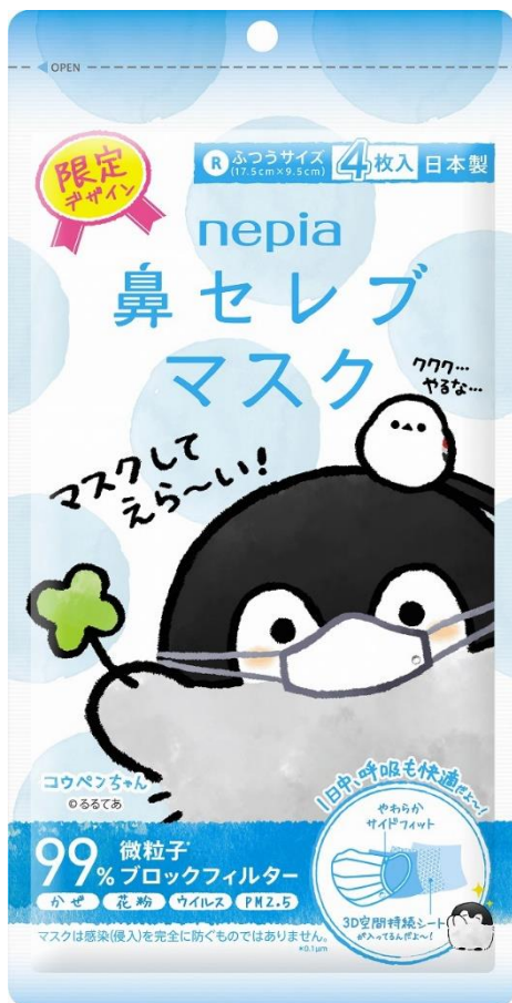
ネピア 鼻セレブマスク ふつうサイズ コウペンちゃんオリジナルパッケージ