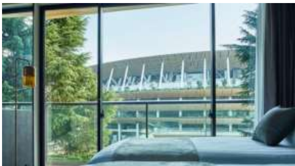
客室から望む新国立競技場