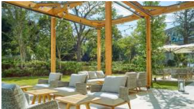
レストラン(テラス席)