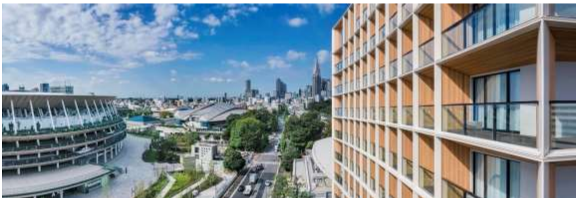
ホテル外観と新国立競技場側の眺望

ルーフトップテラスからは、新国立競技場を眼下に望むことができ、渋谷や六本木方面を見渡せる当ホテルならではの景色をご堪能いただけます。また、毎年 8 月に開催される神宮外苑花火大会を、ルーフトップテラスはもちろん、客室バルコニーより間近で迫力の花火をご鑑賞いただけます。