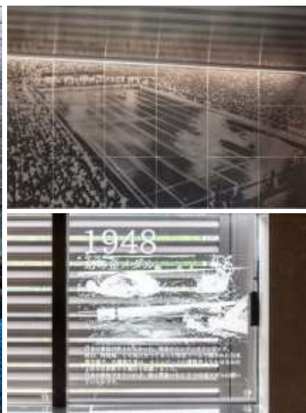
上:壁面アート 下:ガラス面アート