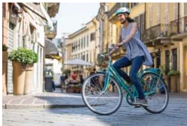
「Bianchi」レンタサイクル(イメージ)

サイクルヨーロッパジャパン株式会社ご協力、宿泊者限定レンタサイクルサービス。イタリアの老舗自転車ブランド「Bianchi」のロードバイクを2台、ご用意しました。おすすめのサイクリングコースを紹介したパンフレットもございます。