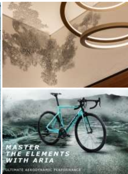
上:「光」がテーマの壁面コンセプトアート 下:「Bianchi」ロードバイク(イメージ)