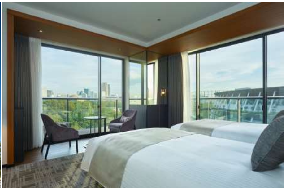
客室(デラックスツイン)