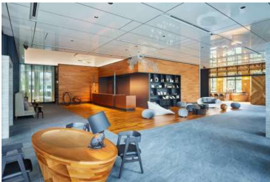
レセプションロビー

エントランスを抜けると、石と木を基調としてしつらえた 200 m 2 超の開放的なレセプションロビーが広がります。広々とした空間に温もりのあるインテリアやアートを配し、アートギャラリーを思わせる空間が訪れるゲストをお出迎えいたします。それぞれのアートは、「杜＝過去」「水＝現在」「光＝未来」をテーマに、「神宮外苑の杜の歴史を未来へつなぐ」想いを表現しました。また、ホテル周囲はサイクリングコースが豊富なことから、イタリアの老舗自転車ブランド「Bianchi」(ビアンキ)のロードバイクをロビーのオブジェとして採用しました。