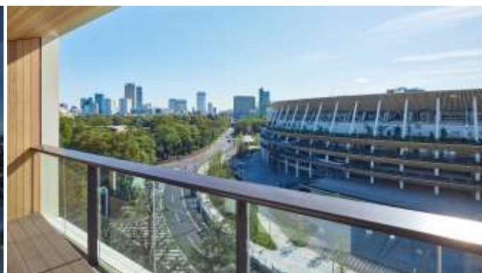
8階客室バルコニーからの眺望