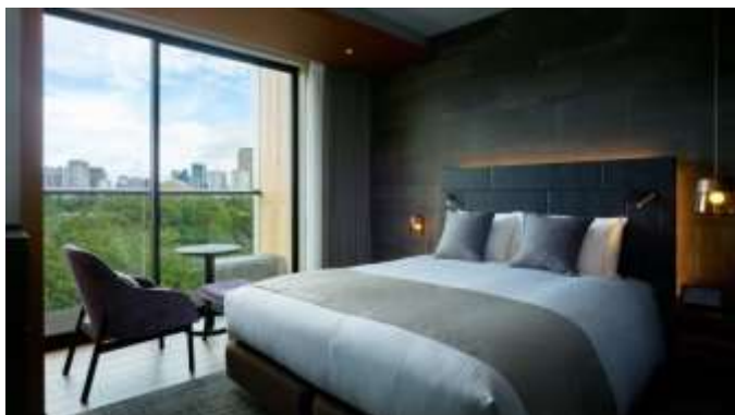
客室(モデレートクイーン)

客室は、全室が2名以上でご利用いただける広さを確保し、全9タイプご用意しました。全客室にバルコニーを設け、神宮外苑や新宿御苑の豊かな緑を望むガーデンビューとともに、ビル群の都会的な眺望をお楽しみいただけます。室内に石調・木調の素材を取り入れることでバルコニーとの一体感が生まれ、リゾート感溢れる客室デザインを実現。また、扁平梁とガラスの手すりを採用することで、室内から眺める視界が広がる設計を採用しました。最上階には、特別なひとときにふさわしい専用のプライベートテラス付きスイートルームを特設しました。