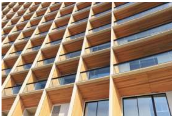
「曲線」と「木」を基調とした外観デザイン