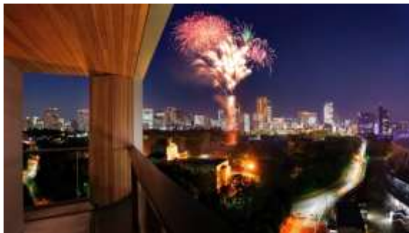
客室バルコニーから望む神宮外苑花火大会(イメージ)