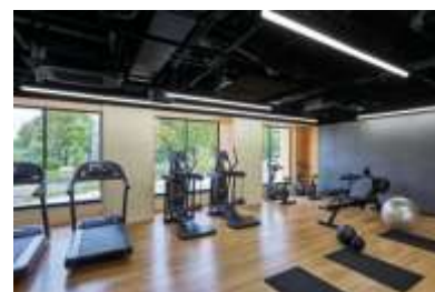
フィットネスルーム

スタイリッシュなデザインが人気のイタリア製トレーニングマシン「テクノジム」を導入。大きな窓のある開放的な宿泊者専用フィットネスルームで、天候や気温を気にせずトレーニングを楽しむことができます。