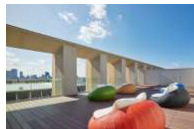
ルーフトップテラス

神宮外苑の杜と新国立競技場を眼下に臨み、渋谷や六本木方面を広く見渡せる宿泊者専用のルーフトップテラスを配置しました。夜明けから夕暮れへと移り変わる景色はもちろん、都心の煌めく夜景、神宮外苑花火大会も間近で観覧いただけます。