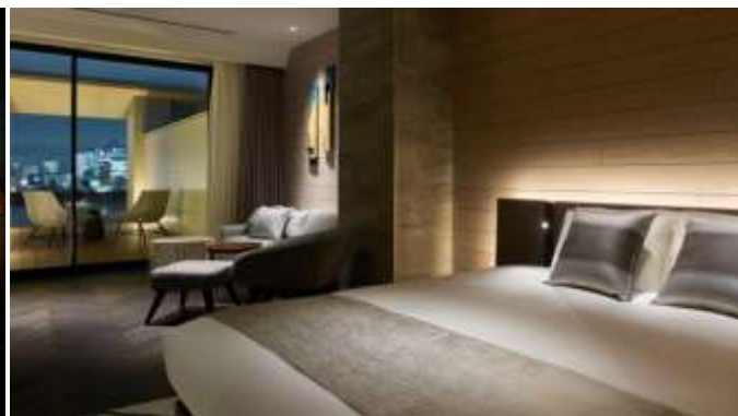
客室(ジュニアスイートキング)