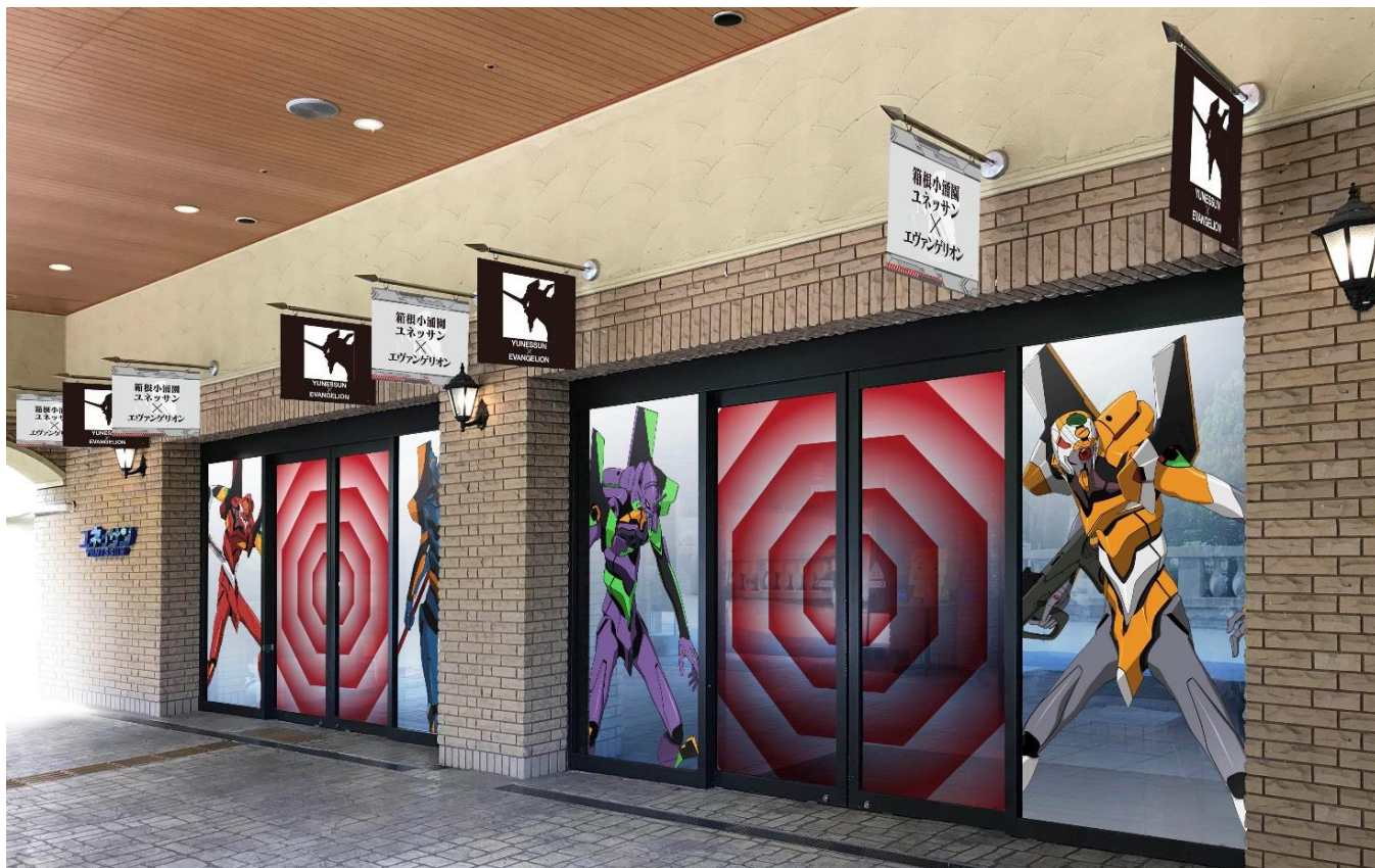
▲正面玄関(イメージ)

館内・館外各所においてもエヴァンゲリオンの世界感がお楽しみいただける装飾を施します。