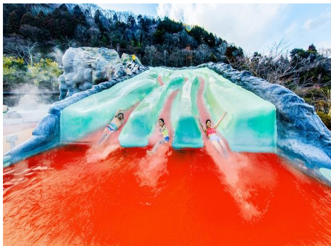
▲ロデオマウンテン(イメージ)