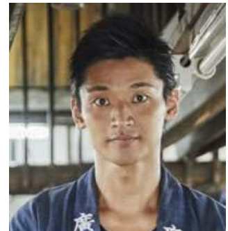
廣瀬 雄一(ひろせ ゆういち)

ファッションジャーナリスト、アート・プロデューサー。VOGUE、ELLE の副編集長を経て2008年より「マリ・クレール」の編集長を務め、独立。ファッション、アート、デザインから、社会貢献、クール・ジャパンまで、カルチャーとエシカルを軸とした新世代のライフスタイルを提案。地場産業や伝統産業の開発事業、地域開発など、地域創性に数多く取り組む。2016年より文化庁日本遺産のプロデューサーを務める。2018年より、伝統工芸ベースのジュエルブランド「HIRUME」をスタート。(https://www.hirume.jp) 三重テラスクリエイティブ・ディレクター、日本エシカル推進協議会副会長、レクサス匠プロジェクトアドバイザー、東京2020ブランドアドバイザーグループ委員、東京2020オリンピック・パラリンピックマスコット審査会副座長、大会スタッフ・都市ボランティアのユニフォームデザイン選考委員会座長。