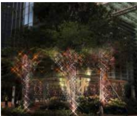
COREDO 室町テラス 植栽 イルミネーションイメージ