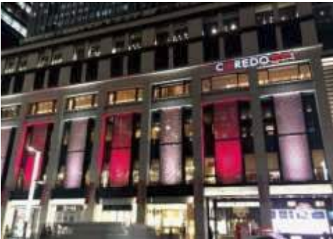
「COREDO 室町1」・「COREDO 室町3」 ※時間によって「江戸紫」「橙」「若草」「白」色に変化いたします。