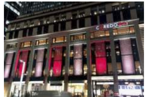
～日本橋の街が「江戸小紋」調の暖かな紅と白い光で包まれる「真紅の光街～日本橋～」 ※写真は昨年時の様子