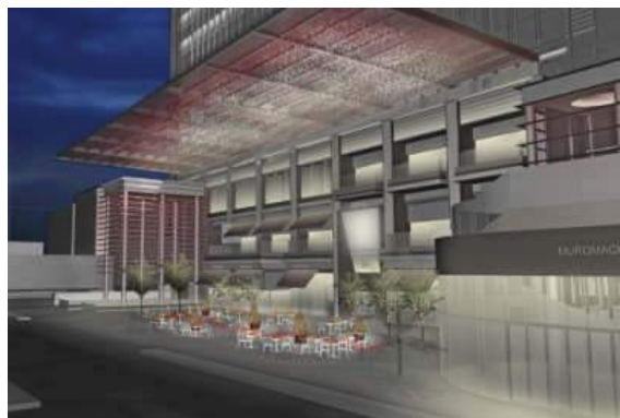
COREDO 室町テラス 大屋根広場 ライトアップイメージ 広場演出監修：内原智史デザイン事務所