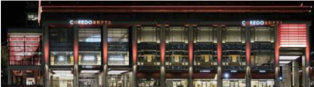
COREDO 室町テラス ファザード ライトアップイメージ

期 間：COREDO 室町テラス大屋根広場ライトアップ 11月28日(木)～12月25日(水) 17:00～24:00 COREDO 室町テラス植栽イルミネーション 2019年11月28日(木)～2020年2月14日(金) 17:00～24:00 場 所：日本橋室町三井タワー(COREDO 室町テラス)