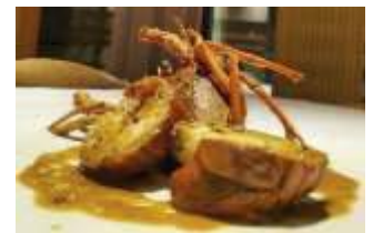
三重県直送 伊勢海老 マルサラ酒蒸し ブラッドオレンジとバジリコのソース

場 所 : 三重テラス レストラン・ショップ(中央区日本橋室町2-4-1 YUITO ANNEX 1階)