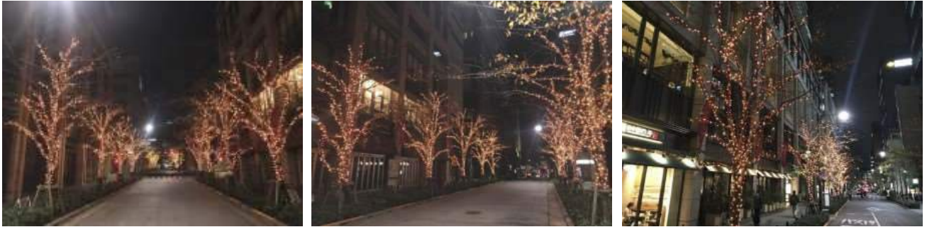
※写真は昨年時の様子

期 間：2019年11月28日(木)～2020年1月15日(水) 17:00～24:00 場 所：江戸桜通り