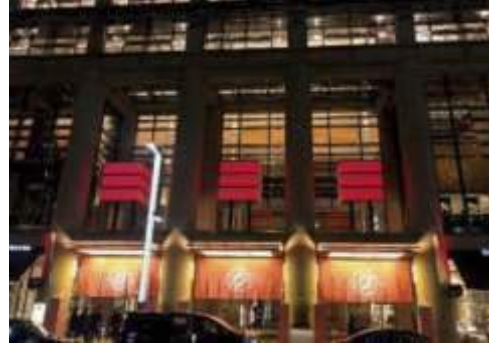
「日本橋三井タワー」