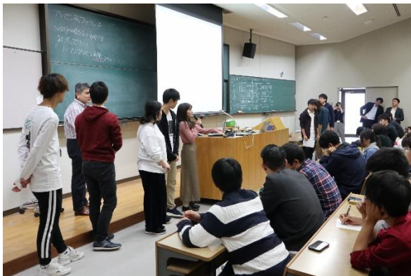
経営データ概論でプレゼンを行う大学生

データサイエンス人材には、さまざまなデータをそれにふさわしい手法で分析できる高度な分析力、データの社会背景を正しく把握するビジネス力、分析結果を実社会に活かす社会実装力が求められています。