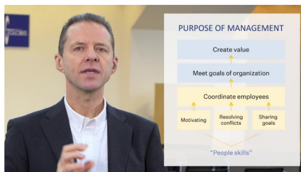
学習コンテンツ(動画)イメージ

グロービスでは、2016年8月に「グロービス学び放題」の提供を開始。現在までに、法人・個人を合わせ、有効会員6万人を超える受講者、累計1000社以上の法人企業に活用いただいています。2018年1月には、中国語版サービス「グロービス無限学」(中国語名称:「顾彼思無限学」)の提供を開始し、導入企業は300社に達しています。「GLOBIS Unlimited」では、世界中の方へ、ビジネスで活躍するための学びを届けられるよう、グローバル企業や海外進出に注力する日本企業に向けて、導入を進めます。