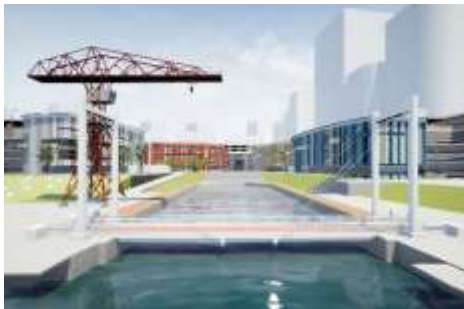
「ららぽーと豊洲」海側リニューアル

既存の「ららぽーと豊洲」も、2020年春、「豊洲ベイサイドクロス」のオープンにあわせてリニューアルを実施します。オフィスワーカーや住民の増加(注1)といった、「まちの成長」に合わせて、「ららぽーと豊洲」開業以来最大となる約70店舗のリニューアルを実施するほか、外壁の全面塗替えに加え、フードコートの拡張、授乳室ほかサービスの拡充を行う予定です(後日リリース予定)。