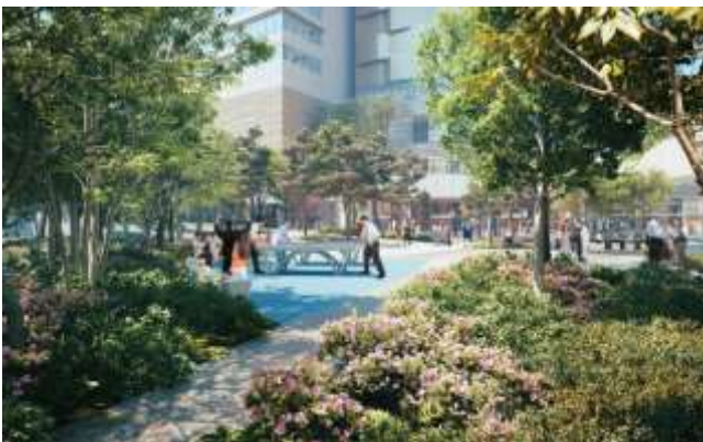
ピンポンフォレスト

豊洲公園から連続した緑豊かな「ピンポンフォレスト」「クロスプラザ」は、オフィスワーカーから周辺住民、来訪者までさまざまな人が一息ついたり、卓球などでリフレッシュすることが可能です。加えて、入居テナント専用の Wi-Fi 環境を整備しており、ワークプレイスとして利用することも可能です。イベントの開催等も予定しています。