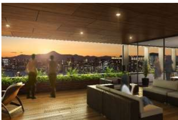
オフィスフロア 屋外テラス

当タワーへは、テナントの一社として TIS インテックグループにご入居いただく予定です。TIS インテックグループでは仕事の内容に応じて働く場所を変える「アクティビティ・ベースド・ワーキング (ABW : Activity Based Working)」や ICT 技術を導入し、働き方改革を加速させる計画を進めています。