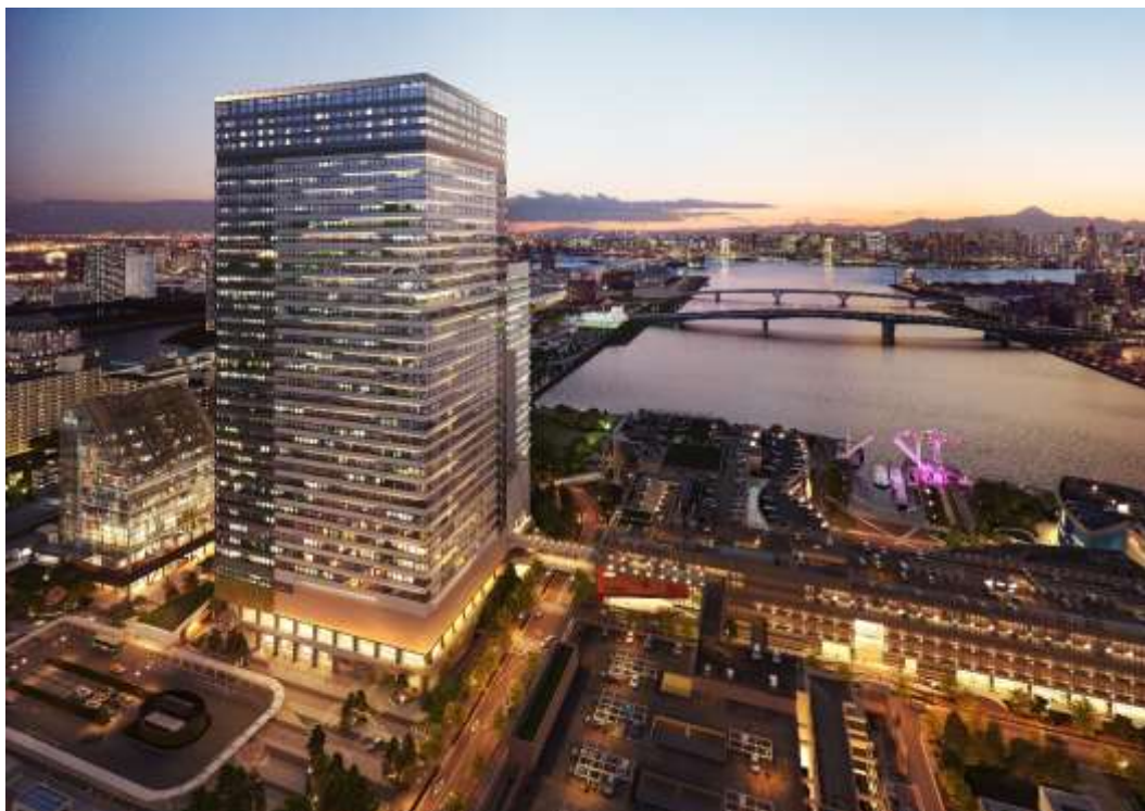
「豊洲ベイサイドクロス」 夕景外観(イメージ)