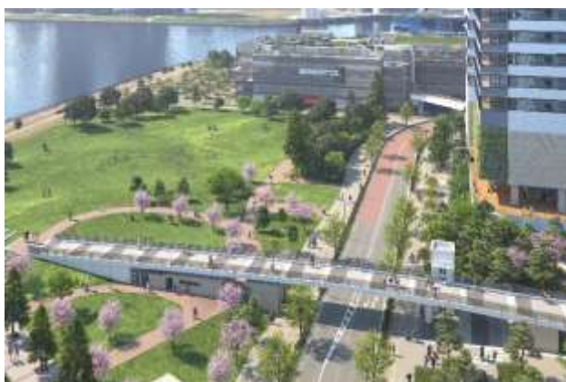
豊洲公園にかかる「豊洲パークブリッジ」(イメージ)

1980年代から始まった豊洲二・三丁目再開発における大規模再開発として今回誕生するのが、「豊洲ベイサイドクロス」です。銀座エリアまで10分圏内(東京メトロ有楽町線「銀座一丁目」駅まで約6分)と都心にありながらも“海”や“緑”を感じられる豊洲という立地を活かすべく、本計画では、隣接する豊洲公園にかかる「豊洲パークブリッジ」を建設します。また、本計画から既存の「ららぽーと豊洲」にダイレクトアクセスが可能なデッキを整備します。ゆりかもめ・東京メトロ有楽町線「豊洲」駅に直結する本計画を中心に、周囲エリアとのネットワークを形成、回遊性を高めることで、縦の複合開発だけではなく、公園や海、ショッピングゾーンにも簡単にアクセスできる面的な複合開発として、エリア全体としてのにぎわいを創出します。