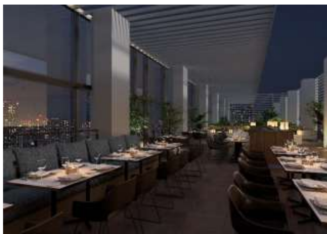
イタリアンレストラン