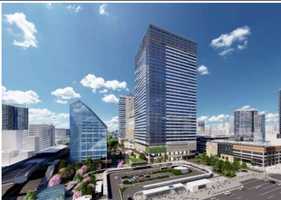
「豊洲ベイサイドクロスタワー」 外観(イメージ)