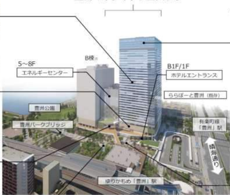
33~36F 三井ガーデンホテル 豊洲バイサイドクロス