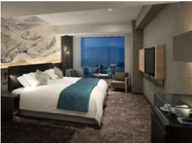
スーペリアツイン

客室は全225室で、33階～35階に位置しています。ダブルやツイン、トリプルなど、ビジネス利用からゆったりとした連泊利用まで、幅広く対応できる部屋をご用意しています。東京タワーやレインボーブリッジの夜景を楽しむことができる客室と、落ち着いた庭園を臨む客室があります。また「ビューバスルーム」では、バスルームからも街や海を一望できます。