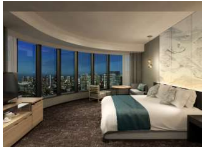
エグゼクティブビューバスコーナーキング