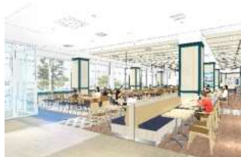
「ららぽーと豊洲」フードコートリニューアル