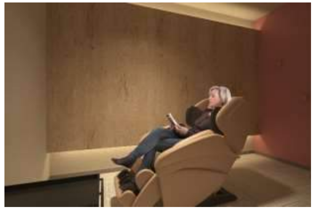
「+C」リフレッシュルーム