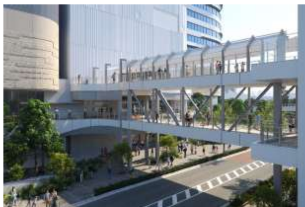
「ららぽーと豊洲」に繋がるデッキ(イメージ)