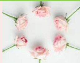
◆HIBIYA BLOSSOM FLORAL GIFT