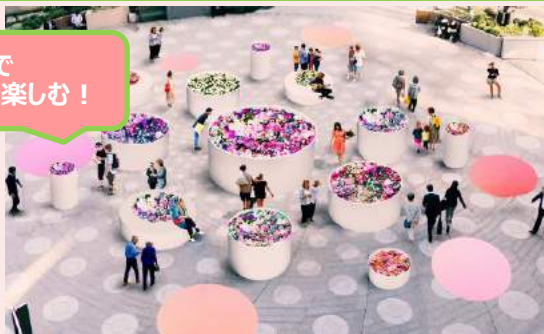
◆HIBIYA BLOSSOM GARDEN