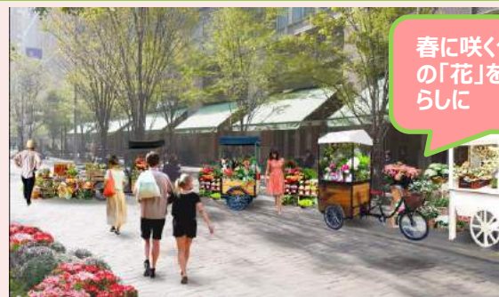
◆HIBIYA BLOSSOM MARCHE