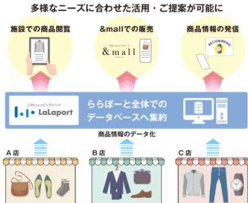
RFID 活用のスキーム図