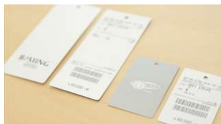
実際に使われている RFID タグ

本実験では、三井ショッピングパーク ららぽーと TOKYO-BAY、ららぽーと立川立飛に出店している「B:MING by BEAMS」店舗内に複数の RFID 読み取りアンテナを配置し、商品に取り付けられた RFID タグ情報の自動読み取りを行います。この技術を用いて店舗内の商品在庫情報を自動的にデータ化することができるようになります。