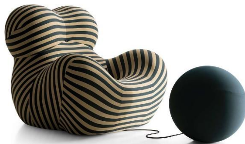
B&B Italia “UP”