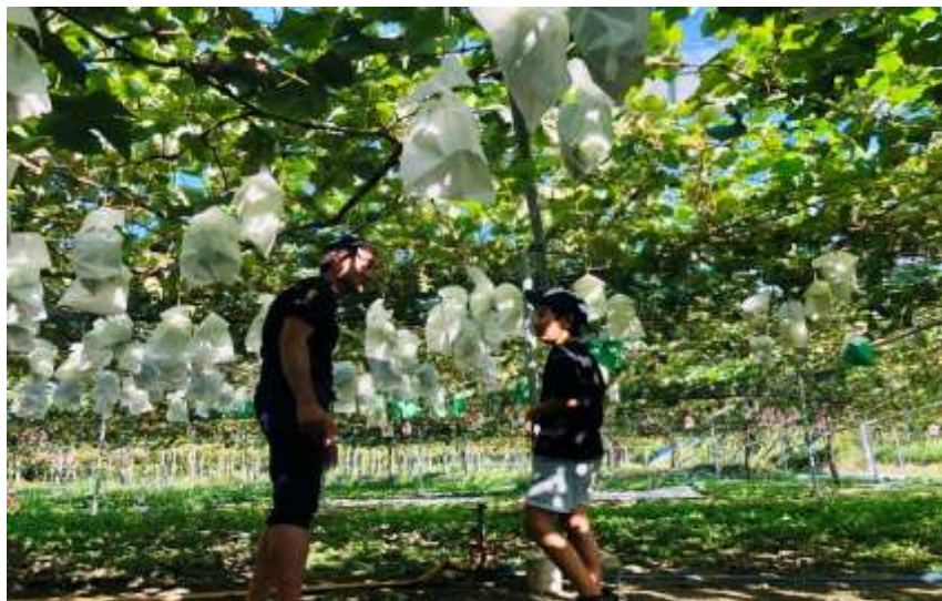
日本・ニュージーランドでの通年生産イメージ(日本式のぶどう棚で露地栽培)

※三井不動産グループ内で新規事業案を募集し、採用された場合提案者自らが責任者として事業を実施する制度