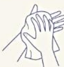
清潔なタオルまたは ペーパータオルで 水気をふきとります