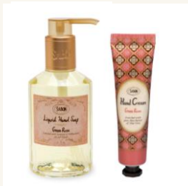
プチハンドケアセット デリケート・ジャスミン 税抜価格3,164円

ハンドソープボトル パチュリ・ラベンダー・バニラ 200mL ハンドクリーム パチュリ・ラベンダー・バニラ 30mL 香り： SABONを代表する神秘的で優しくフェミニンな香り