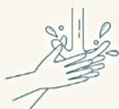
手を水で濡らします

手洗いに関心が高まっている今、 ボディケアリチュアルを提案し続けてきたSABONとして、 ベーシックな手洗い方法を公式SNSにてご紹介しております。 SABON製品は、身体の清潔を保つだけでなく、豊かな香りで気持ちをリラックスしたり、 植物由来の保湿成分で洗い上がりの後肌をしっとり乾燥から守ります。 使って頂くお客様に心身共に癒されて頂くことがSABONからの提案です。