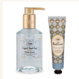
プチハンドケアセット グリーン・ローズ 税抜価格3,164円

ハンドソープボトル デリケート・ジャスミン 200mL ハンドクリーム デリケート・ジャスミン 30mL 香り： ジャスミンのブーケのような上品ですがすがしい香り