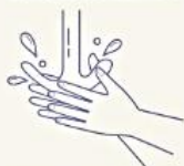
流水でしっかりすすぎます