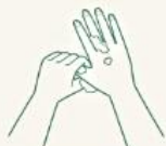
親指を軽く握って 回すような動きで洗います