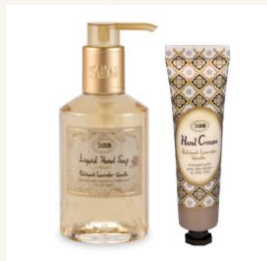
プチハンドケアセット パチュリ・ラベンダー・バニラ 税抜価格3,164円

ハンドソープボトル パチュリ・ラベンダー・バニラ 200mL ハンドクリーム パチュリ・ラベンダー・バニラ 30mL 香り： SABONを代表する神秘的で優しくフェミニンな香り