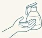
ハンドソープを たっぷり手に取ります