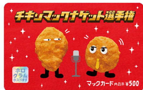
【マックカード デザインイメージ】

※マクドナルドでは食を扱う企業の責務として商品のアレルギー・栄養情報、原産国情報をお知らせしています。常に最新の情報を公開しており、商品のパッケージについている QR コードをご利用いただくと公式ウェブサイトにある商品の情報ページを簡単にご確認いただけます。「アレルギー検索」、「栄養バランスチェック」といったお役立ちツールも提供しておりますので、ご提供している情報とあわせ、商品をお選びいただく際や食事の栄養バランスを考える上でお役立てください。