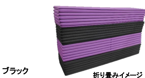
折り畳みイメージ