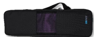
別売:フォールディングヨガマット用特製ケース 1,800円(税抜)

フォールディングヨガマットは折り畳み式で、準備や収納も簡単。長尺が182センチと長身の方でも余裕で使える長さなのに重さが超軽量、約980グラム! 折り畳み方次第で22通り以上の使い方ができ、優れたクッション性と高いグリップ力により、ヨガだけでなくピラティスや筋トレ、アウトドアでも大活躍します。また、素材本来の特質で、床から来る痛みを軽減し、洗えて無臭、傷つきにくい等15の特長があります。