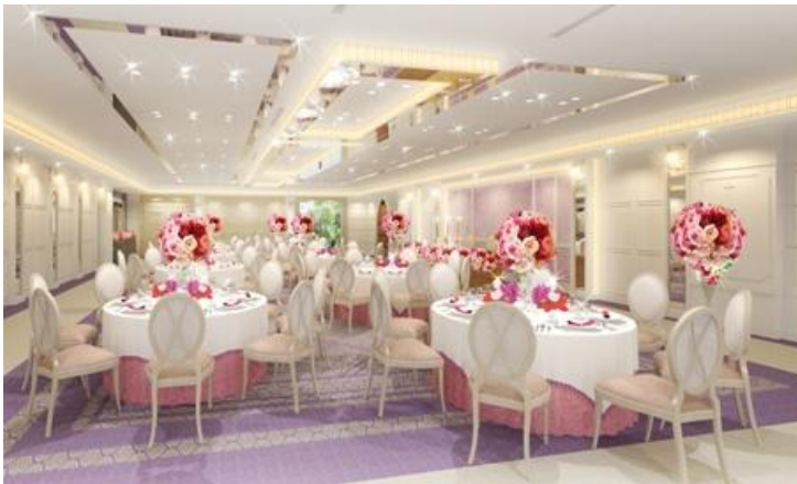
↑カシオペア：披露宴会場（完成予想図）

また、これらの空間は新郎新婦がシーンによって思い通りに使うことができます。専用廊下にふたりの思い出の品を飾る、「Welcome」の気持ちを伝える小物を配置する、ウッドデッキに出て緑のなかでゲストと記念撮影をするなど、大切なゲストをおもてなし、感謝の気持ちを伝えることができます。