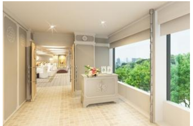
↑ソレイユ：前室（完成予想図）

ホテル椿山荘東京のウェディングコンセプトである、「Many Thanks Wedding～ふたりの感謝の気持ちをカタチに。～」そんな世界にたったひとつの結婚式をつくるため、私たちが心をこめてお手伝いします。