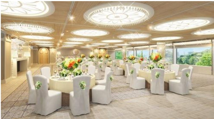
↑ソレイユ：披露宴会場（完成予想図）

オーナメントがきらきらと輝く太陽モチーフの照明をはじめ、既存の大きな窓、ミラー素材や光沢のあるタイルを用いた柱により、洗練された雰囲気の中、より一層の明るさが広がります。また、飾り棚のあるコンソールやオーナメントを吊り下げた天蓋、ゆったりとしたカウチを配し、カジュアル過ぎず、かつ親密で寛げる空間を演出します。スタイルソムリエが提案する、生演奏と美食のセッションにより、贅沢で和やかなひとときをお過ごしいただけます。