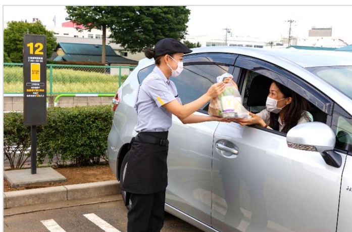
左：新サービス「パーク＆ゴー」は車に乗ったまま商品を受け取れます。

「パーク＆ゴー」は今後も導入をさらに進め、2020年末までに約300店舗での利用開始を目指してまいります。本サービス対応店舗では、「モバイルオーダー」で商品選択の後のステップにて、ご利用方法の選択肢の中でチェックが入れられるようになっています。