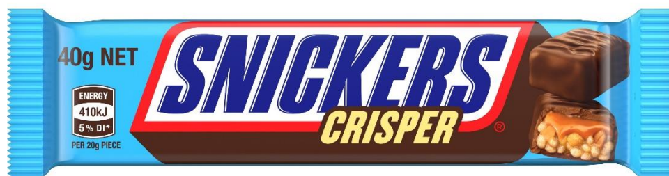
スニッカーズ® クリスパー

マース ジャパン リミテッド（本社：東京都港区、社長：シュミット・カプーア）は、人気のチョコレート「スニッカーズ®」から、ライスパフとキャラメル、ピーナッツをミルクチョコレートでコーティングした、サクサク食感の「スニッカーズ® クリスパー」（名称：準チョコレート菓子）を6月29日より全国のコンビニエンスストアにて先行発売し、9月28日より全国のスーパーマーケット等、一般チャネルにて期間限定で発売します。