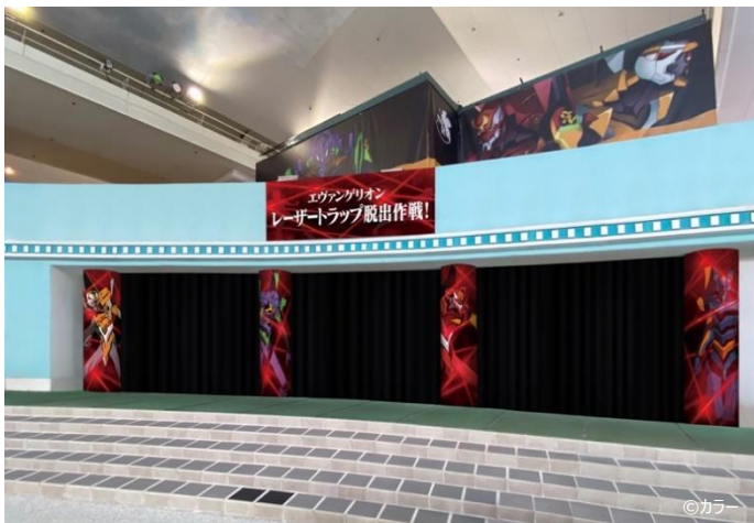
▲エヴァンゲリオンレーザートラップ脱出作戦 外観(イメージ)

暗闇の中に放射される赤いレーザートラップ(映画などによく登場する警備システム)を、全身を駆使して華麗に避けながら進んでいく体験型のアトラクションとなっております。参加者はエヴァンゲリオンのキャラクターになりきって知恵と経験、身体能力でクリアを目指します。見事クリアされたお客様には、ユネッサン限定のエヴァンゲリオンステッカーをプレゼントいたします。