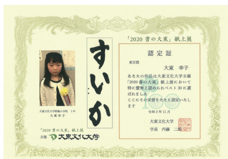
見本：認定証（有料版）