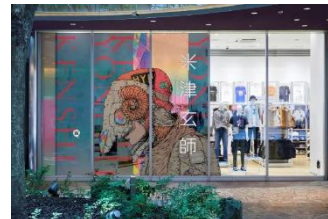
キャナルシティ博多店