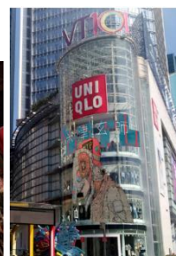
広州ビクトリー広場店