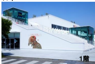
UNIQLO PARK 横浜ベイサイド店