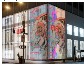
ニューヨーク 5 番街店