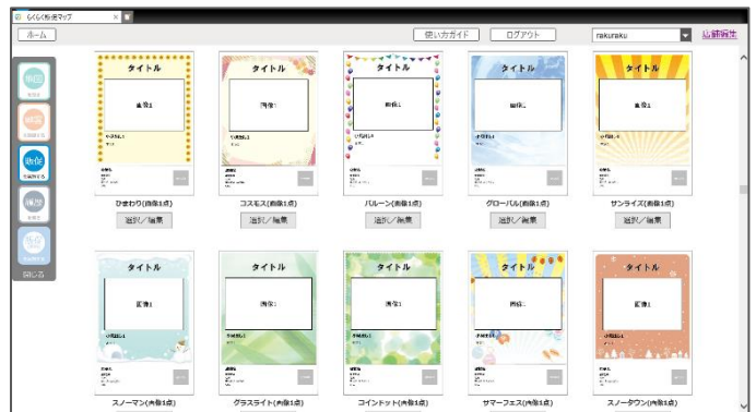
テンプレートを使ったチラシ作成画面