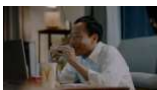
塙さん: 今夜は、ごはん バーガーです。