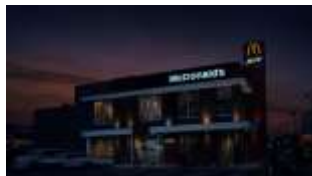
塙さん NA: 夜のマックに行った