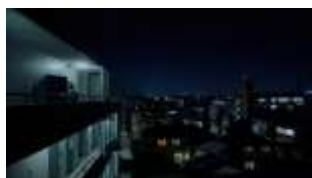
塙さん NA: いまは、