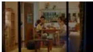
幸せ家族: いただきまーす!