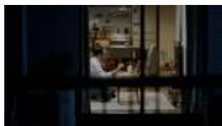
塙さん NA: さまざまな家族の カタチがある。