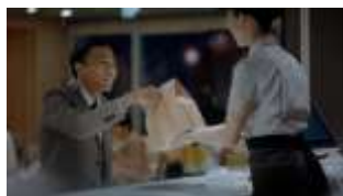
塙さん: 復活したんですね。