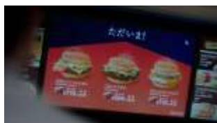
店員: お待たせ いたしました