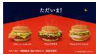
NA: ただいま、 ごはんバーガー。