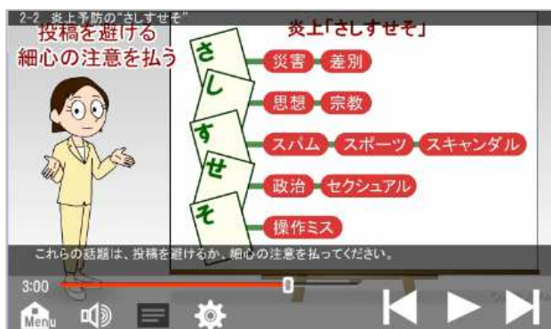
「2-2 炎上予防の“さしすせそ”」より