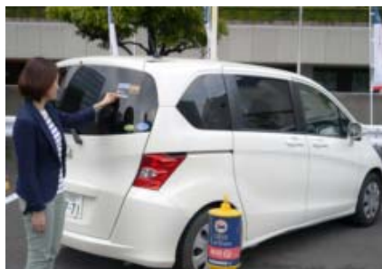
オリックスカーシェア

(参考) 本日、この資料は国土交通記者会、都庁記者クラブ、自動車産業記者会にお届けしています。