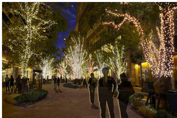
日比谷仲通りの様子 イメージ

毎年、このイルミネーションが点灯することで日比谷エリアが一気にクリスマスらしさを帯びる「HIBIYA Area Illumination」。今年の日比谷エリア全体を彩る樹木のイルミネーションは、メインカラーを希望と平穏をイメージした“キャンドルカラー”に統一し、温かみを感じられる空間を演出します。樹木によって「シャンパンゴールド」「ゴールド」「アンバー」の異なるカラーの装飾を施しており、統一感がありつつも見る場所によって雰囲気の変化を楽しんでいただけます。大人な魅力が溢れる街日比谷にぴったりのきらめきは、大切な人と訪れたいこと間違いなしです。