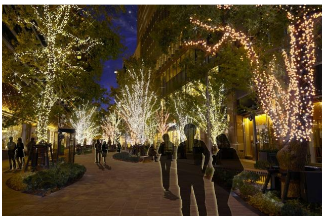
「HIBIYA Area Illumination」イメージ