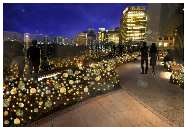
「PARK VIEW WINTER GARDEN」イメージ

※本リリースの内容は予告なく変更・中止になる場合がございます。予めご了承ください。