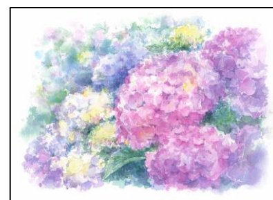
野村先生作品 あじさい (スケッチブック オリーブを使用)

この2つは「図案」と同じ汎用画用紙ですが、より紙が厚く水を使うときに比較的シワになりにくいので、相対的に描きやすいと言えます。