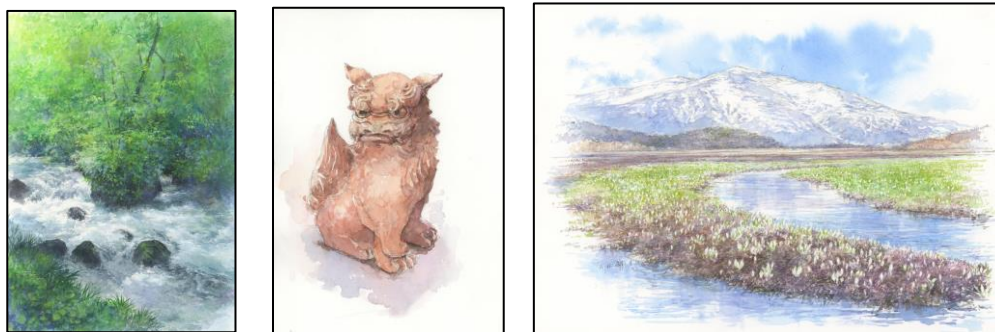
野村先生作品 左:緑溪-石ケ戸の瀬 中:シーサースケッチ 右:尾瀬スケッチ (共に図案スケッチブックを使用)