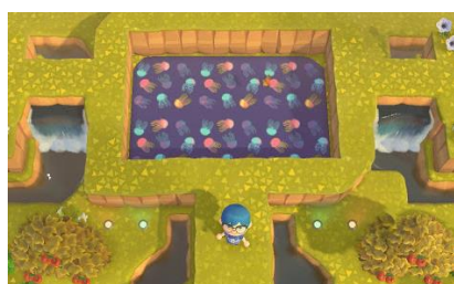
すみだ水族館名物「ビッグシャレ」を再現！