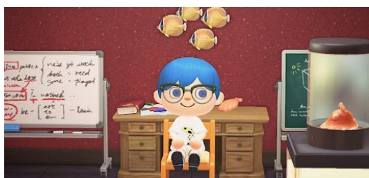
内観はかんちょうさんの執務室をイメージ