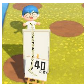
フォトスポットでの記念撮影