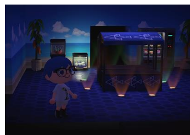
今年リニューアルしたアクアベースを再現！