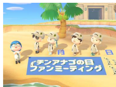
ファンミーティング イメージ

すみだ水族館では、“近づくと、もっと好きになる。”をキーワードに、お客さま、いきもの、スタッフが、もっと近づく水族館を目指しています。なかなか“集まる”ようなイベントができない中でも、お客さまともっと近づくことができるよう、これまでも人気ゲーム「あつまれ どうぶつの森」内で様々なコンテンツをご用意し、当館のコンセプトを存分に取り入れた花火や服のマイデザインを公開してまいりました。そしてこの度、「すみすい島」が遂に完成し、「夢番地」を使って皆さまに遊びに来ていただけるようになりました。※1