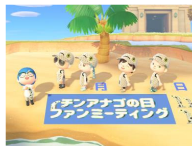
ファンミーティング イメージ