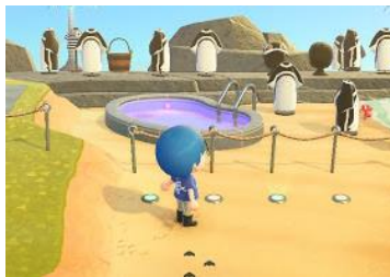
すみだ水族館の岩場展示を再現！