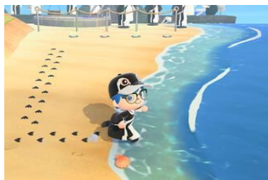
砂浜にはペンギンの足跡が！！