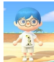
オリジナルTシャツ イメージ