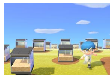
捕獲した大量のチンアナゴが並ぶ「チンアナゴロード」