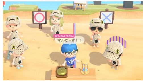
「チンアナゴの日」○×クイズ大会 イメージ