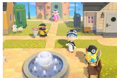
住民はペンギンだけの「ペンギンロード」