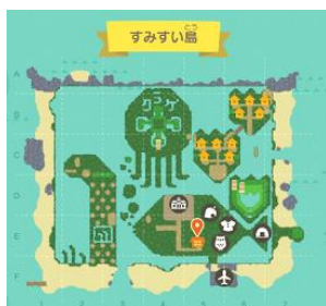
「すみすい島」全体イメージ

すみだ水族館(所在地:東京都墨田区、館長:中村 雄介)は、任天堂株式会社のNintendo Switch(TM)専用ソフト「あつまれ どうぶつの森」のゲーム内で、オリジナルの「すみすい島(とう)」を2020年10月28日(水)より公開します。さらに当館が毎年イベントを開催している11月11日(水)「チンアナゴの日」には、同ゲーム内にて当選者限定のオンラインファンミーティングを開催いたします。