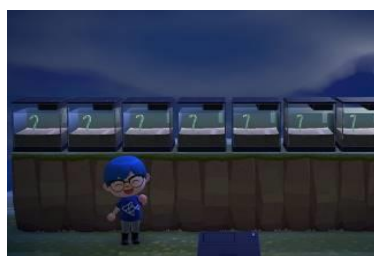
すみだ水族館のチンアナゴ展示を再現！