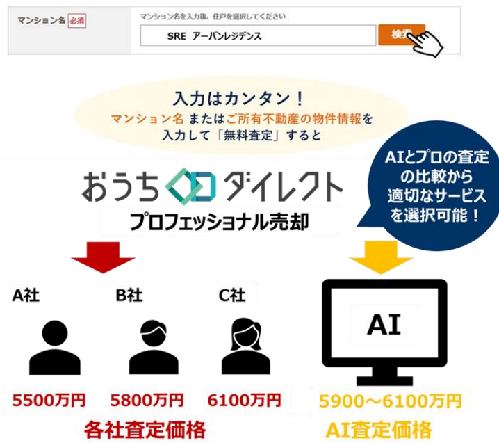
SREHD の不動産価格推定 AI サービス（イメージ図）

※1 AI 査定額を即座に提示し一括査定各社の査定額と比較可能なサービスの提供（SREHD 調べ）